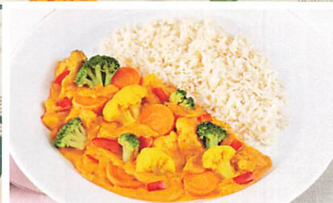
Pikante Gemüsepfanne in cremiger Currysoße

(aus nachhaltiger Fischwirtschaft) dazu Romanesco, Blumenkohl und Brokkoli in Soße und Salzkartoffeln