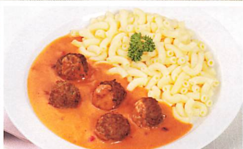
Hackbällchen vom Schwein und Rind

dazu Romanesco-Möhren-Gemüse und Bandnudeln