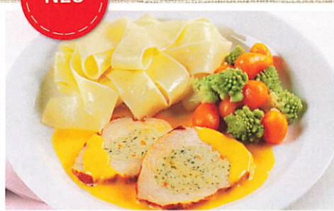
Zarte Putenfilets, gefüllt mit Brokkoli und Karotten in einer Butter-Tomatensoße

dazu Romanesco-Möhren-Gemüse und Bandnudeln