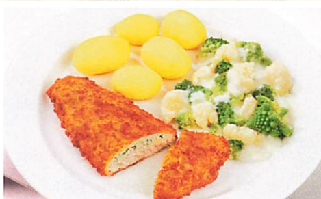
Paniierter Alaska-Seelachs mit Kräuterfüllung

in Preiselbeer-Sahne-Soße, dazu Hörnchennudeln