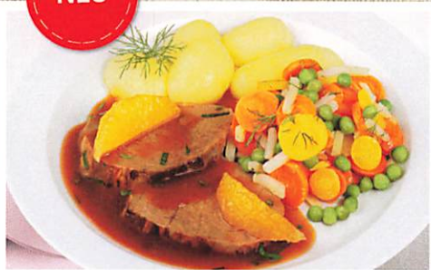
Zarter Kalbsbraten „à l'orange“ mit buntem Frühlingsgemüse und Salzkartoffeln